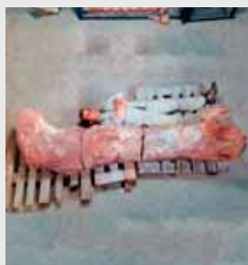
Een onderzoeker poseert bij een gevonden dinodijbeen

REUZEDINO In de provincie Chubut in Argentinië is een betrekkelijk compleet skolet gevonden van een reusachtige dinosau-