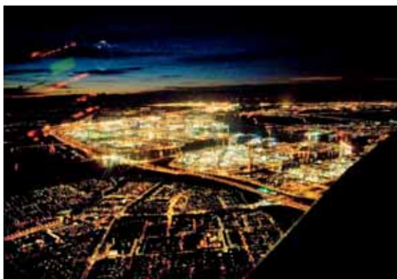
Concentratie van (petro)chemische industrie bij Europoort

Van groot belang is de uitvinding van het laboratorium geweest. Terwijl andere disci-